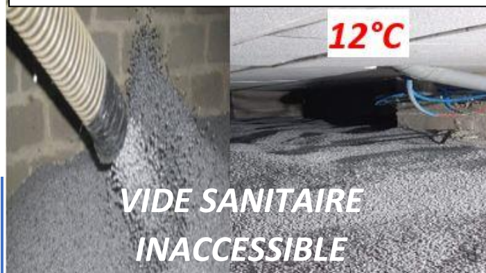
VIDE SANITAIRE INACCESSIBLE

RISQUES SUR LA POLLUTION: l'ECOGRAPHITE 16 kg de carbone spécifique /1000 litres. Neutre sur la qualité de l'air intérieur (ne contient aucun COV ou COSV*), d'où ses approbations pour les cousins d'allaitements, salles de spectacles, et béton industriel en Suisse.