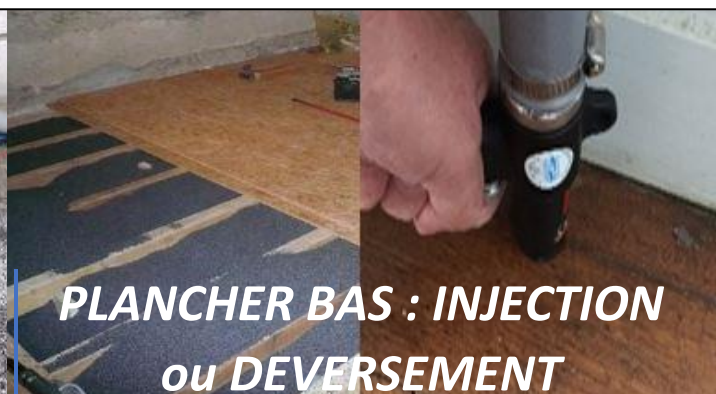
PLANCHER BAS : INJECTION ou DEVERSEMENT